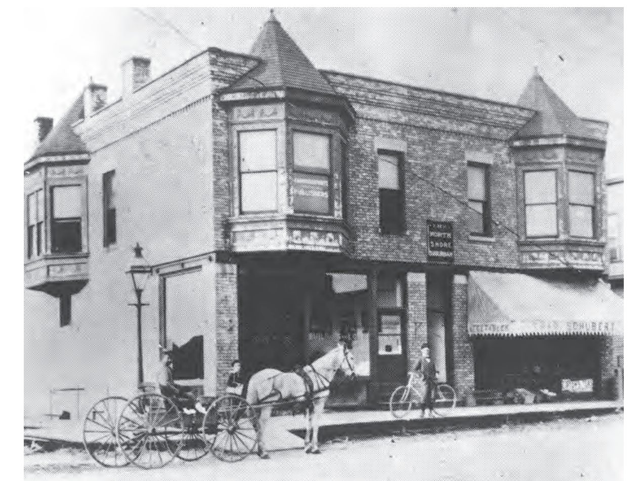
Historic photos of Rogers Park // Fotos históricas del Rogers Park