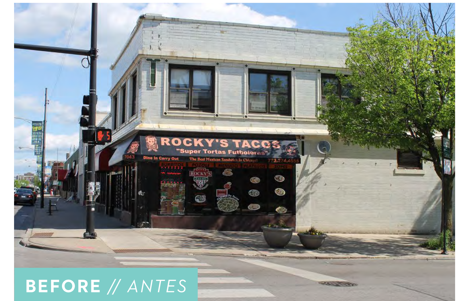
BEFORE // ANTES