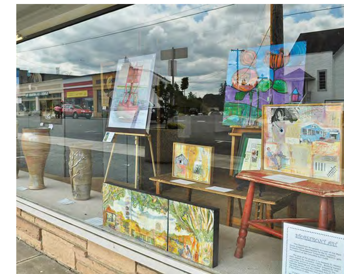
Art in windows // Arte en las ventanas