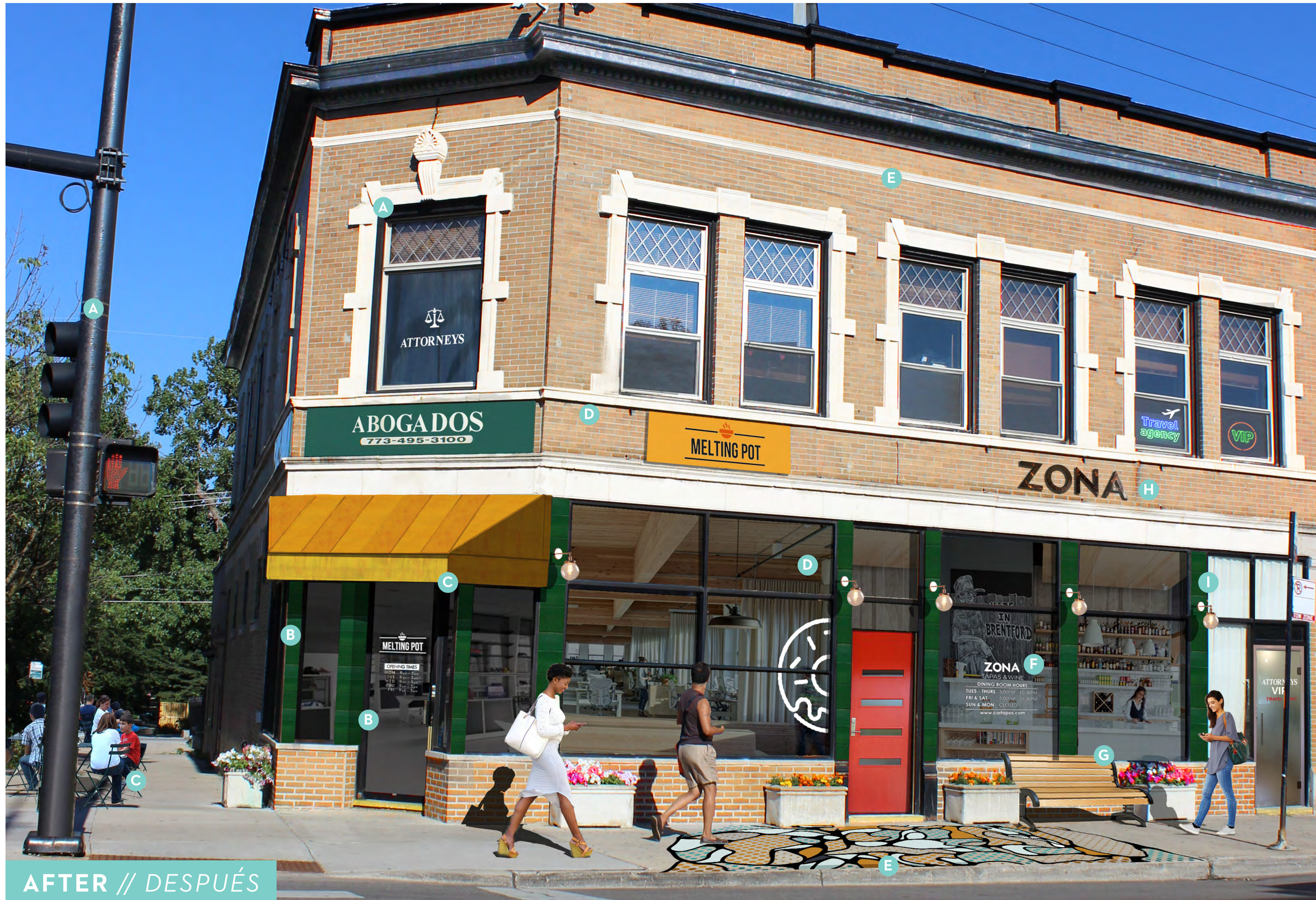
AFTER // DESPUÉS