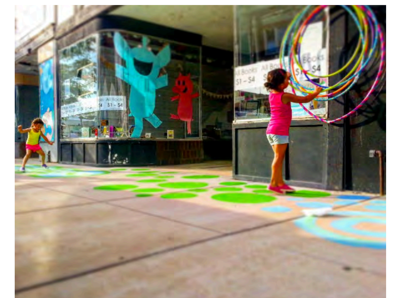
Jump ropes and hula hoops // Cuerdas de salto y hula hoops