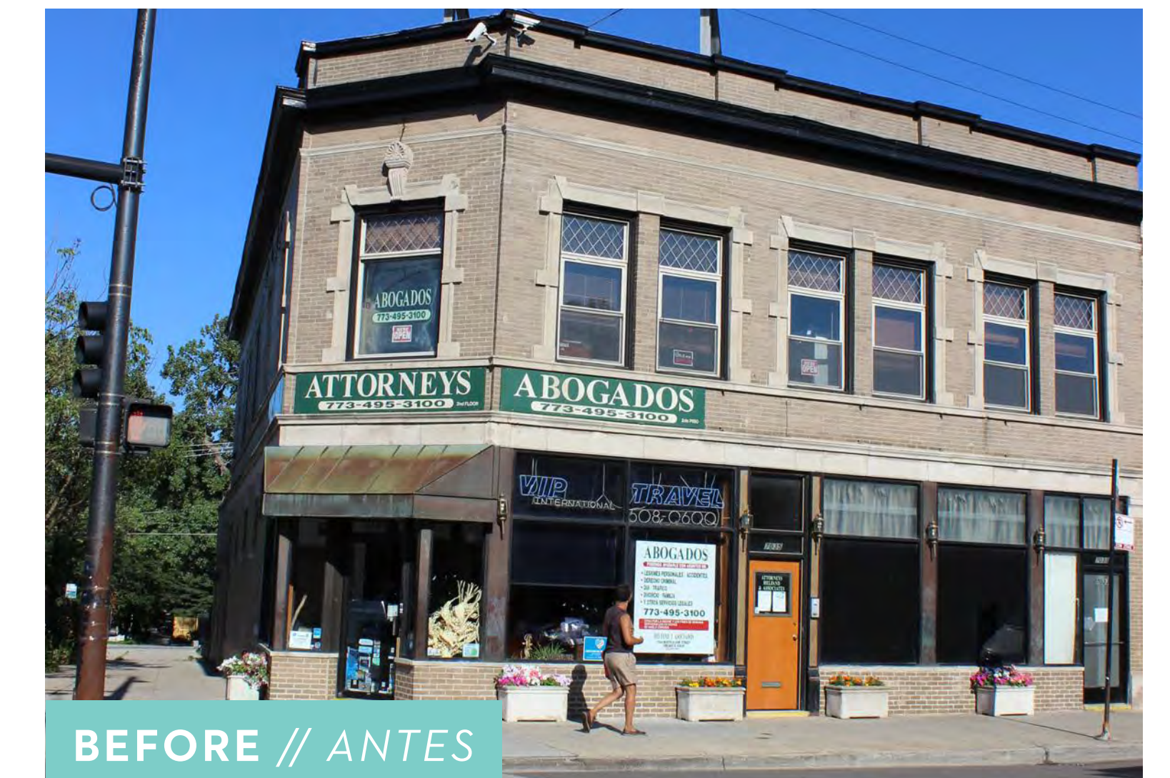
BEFORE // ANTES