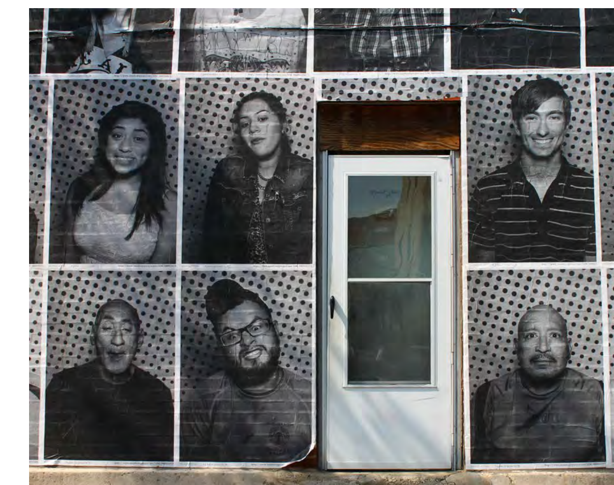
More neighborhood portraits // Más retratos del barrio